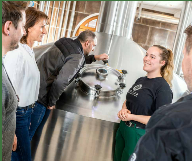
Das moderne Sudhaus ist das Herzstück der Brauerei

Genießen Sie nach einer spannenden Führung bei einer Bierverkostung den Panoramablick vom Hochschloss auf den malerischen Chiemgau.