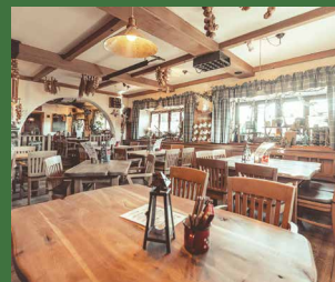
Hex`n Küch in Trostberg

+49 (0) 86 21 – 640 40 servus@hexnkuech.de www.hexnkuech.de