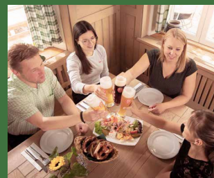
Steiner Bräustüberl in Stein

Unsere Führungen lassen sich optimal mit einer gschmackigen Mahlzeit in unserem angrenzenden Bräustüberl oder in der Hex`n Küch verbinden. Im Baruli können Sie Ihren Ausflug bei Kaffee und Kuchen genussvoll ausklingen lassen - für Einzelpersonen sowie Gruppen.