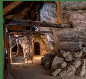
Das „Zwickeln“ der Bierspezialitäten In der Höhlenburg