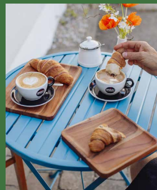
Kaffeerösterei Baruli in Stein