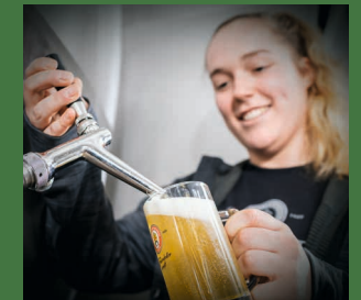
Das „Zwickeln“ der Bierspezialitäten