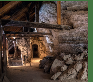
In der Höhlenburg