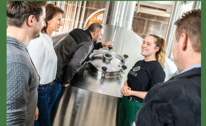
Das moderne Sudhaus ist das Herzstück der Brauerei

Genießen Sie nach einer spannenden Führung bei einer Bierverkostung den Panoramablick vom Hochschloß auf den malerischen Chiemgau.