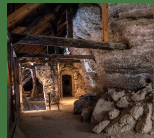
In der Höhlenburg