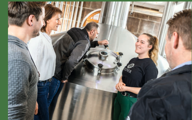
Das moderne Sudhaus ist das Herzstück der Brauerei

Genießen Sie nach einer spannenden Führung bei einer Bierverkostung den Panoramablick vom Hochschloß auf den malerischen Chiemgau.