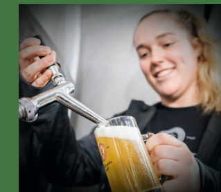
Das „Zwickeln“ der Bierspezialitäten